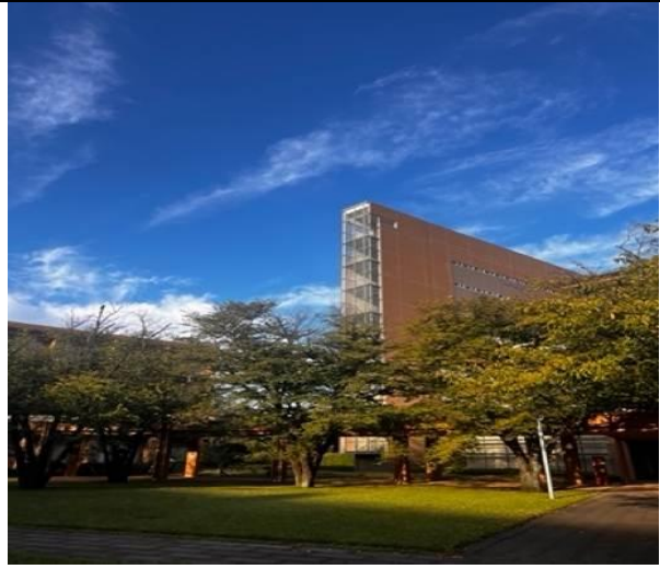
從宿舍可以看到足球場