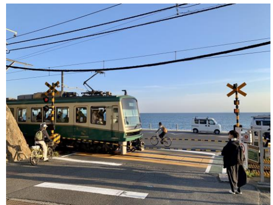
灌籃高手平交道場景(鎌倉高校前)