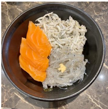
去到鎌倉一定要吃的しらす

去玩川越後又討論了去鎌倉、江之島兩天一夜，因為之前有去過一次發現一天來回太趕了，於是這次選擇裡兩天一夜。